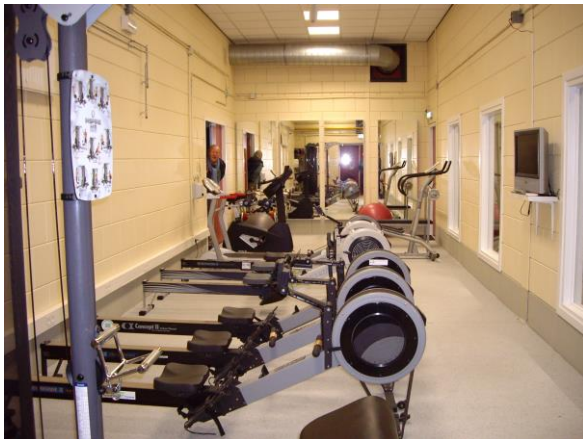
Separaat maar niet geïsoleerd

Separaat, maar niet geïsoleerd, want vanuit de trainingsruimte is er door grote vensters ruim zicht op de roeibak en vice versa. Ook de werkplaats mag gezien worden