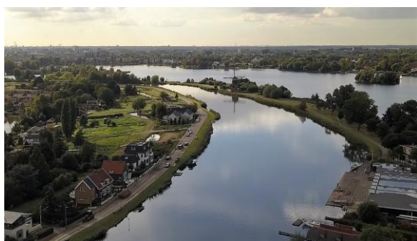
De Rotte in al haar schoonheid