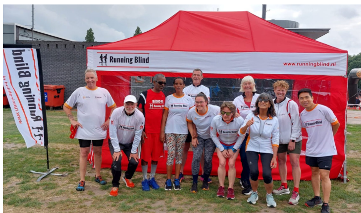
Het team van Running Blind. Klasse dames..!