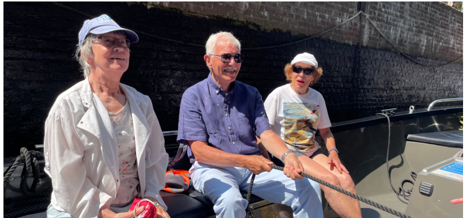
Tijdens de afgelopen Vlettentocht in juni gingen we door het Berg en Broeks Verlaat naar de Bergse Plassen om daar heerlijk rond te varen....