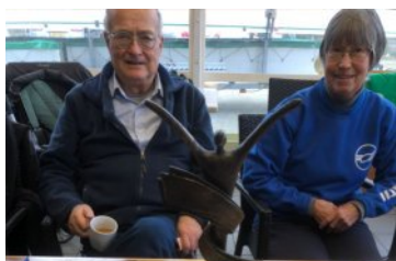
De prijsuitreiking, de taart, de prijs en de banner, proficiat SRV...!